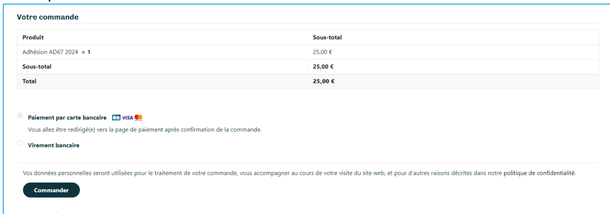
Figure 5 --- Payer votre commande